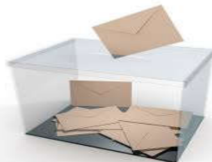
Document 3 : Une urne

Consigne de travail : Effectue les tâches suivantes.