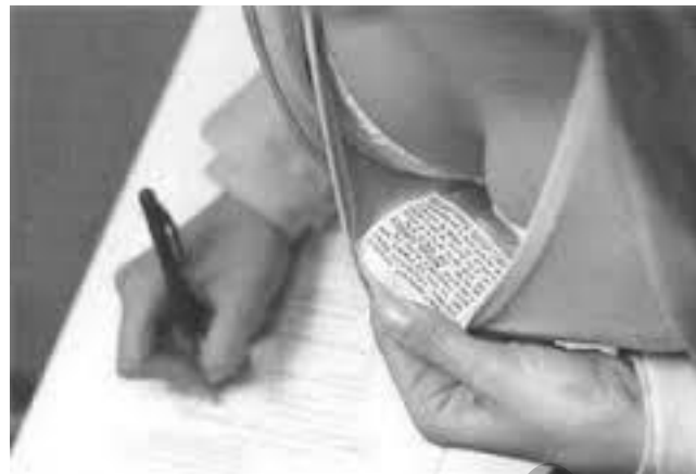
Une collèg enne qui triche