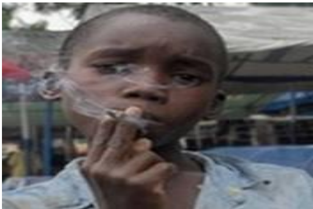
Un adolescent tabagiste